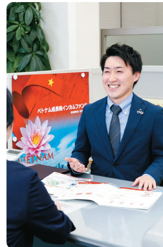
お客様の要望や疑問を引き出す“聞く力”を重視した対話をもとに、相手に寄り添った商品の提案やサポートを行っている