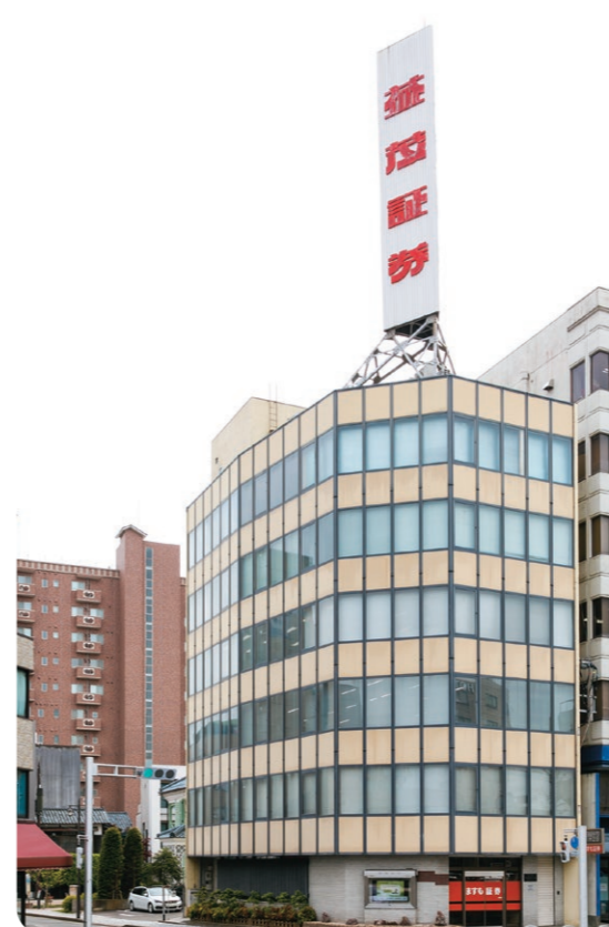
福井市中心部の本社をはじめ、大野市、鯖江市、坂井市に4つの拠点を展開